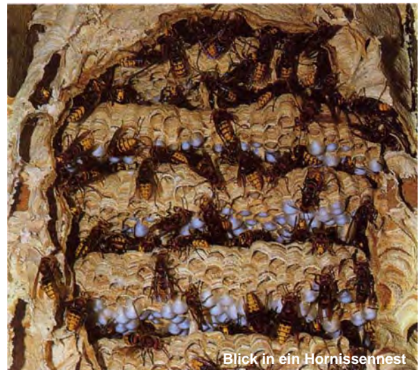
Blick in ein Hornissennest

Seit langer Zeit sind Wespen als Plagegeister und Lästlinge ein Opfer von Vernichtungsaktionen. Dass auch lästige Tiere aus ethischen Gründen ein Lebensrecht genießen, aus ökologischen Gründen (als Teil des Naturhaushalts) schützenswert sind und aus rechtlichen Gründen grundsätzlich gar nicht bekämpft werden dürfen, wird dabei heute häufig nicht bedacht. Rücksichtnahme im Nestbereich, Vorsicht bei der Beobachtung, einfache Vorsichtsmaßnahmen bei Aufenthalt im Freien und vorbeugender Schutz im Haus- und Hofbereich schonen das Leben dieser nützlichen Insekten und ermöglichen meist ein friedliches Nebeneinander. Wer einmal ein Wespen- oder Hornissennest als Kunstgebilde nach dem Verlassen genauer betrachtet, dem eröffnet sich vielleicht ein anderer Blick auf die beeindruckende Lebensweise der Tiere. Vielleicht gelingt es dann, auch wehrhaften und mitunter lästigen Tieren respektvoll und vorsichtig, aber auch vorurteilsfrei und friedfertig zu begegnen.