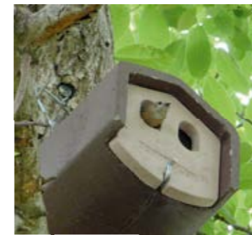
Dieses Gartenrotschwanz-Weibchen zeigte sich während der Kartierung.

Einst war der Gartenrotschwanz weit verbreitet und häufig, doch seit Langem gehen die Bestände stark zurück. Das gilt leider auch für München. Deshalb unterstützen wir die Art durch speziell betreute Nisthilfen – eine Maßnahme, die dank der För-