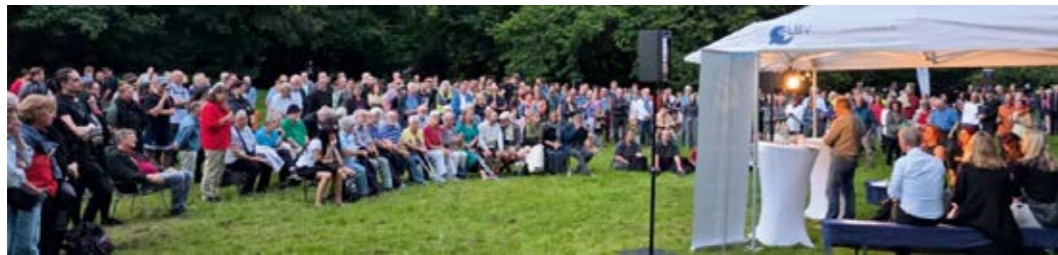
Die große Eröffnungsfeier wollte sich niemand entgehen lassen.