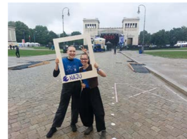
Die NAJU beim Oben ohne Open Air

Und wir wollen wachsen – dafür brauchen wir Dich im Vorstand. Hier kannst du Ideen einbringen und mitentscheiden, wohin sich die NAJU München entwickeln soll. Du willst eigene Projekte umsetzen, coole Aktionen planen oder Dich in der Öffentlichkeitsarbeit