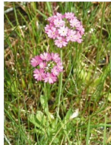
Auch die Mehlprimel soll sich auf den flachen Hängen ansiedeln.

lange nicht mehr und das Vorhaben daher nicht umsetzbar. Erst im April 2025 lief dann alles wie am Schnürchen: Der Grundwasserstand passte, das Unternehmen für die Erdarbeiten stand bereit und mit bodenschonenden Überfahrplattens und viel Engagement schritten wir zur Tat. Innerhalb weniger Tage