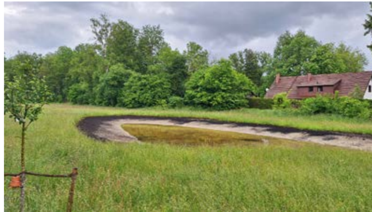
Die Seige im Mai kurz nach ihrer Fertigstellung

Damit sich zeitnah standortgerechte Pflanzenarten ansiedeln, brachten wir im Herbst von verschiedenen LBV-Flächen aus der Umgebung passendes Mähgut auf die flachen Seigenwände aus. Der Vorteil dabei: Es wird nicht nur das Samenmaterial von Duftlauch, Mehlprimel und Co. übertragen, sondern gleich auch die passende Kleintierfauna. Mithilfe einiger Ehrenamtlicher pflanzten wir außerdem knapp achtzig im Rahmen un-