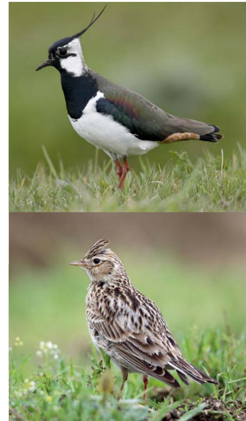
Die Lage ist ernst – Kiebitz und Feldlerche können keine weiteren zwölf Jahre auf ein neues Schutzgebiet warten.

Wir können den Spruch „Bauen, bauen, bauen“ nicht mehr hören, mit dem eine Trabantensiedlung nach der anderen ins Werk gesetzt wird.