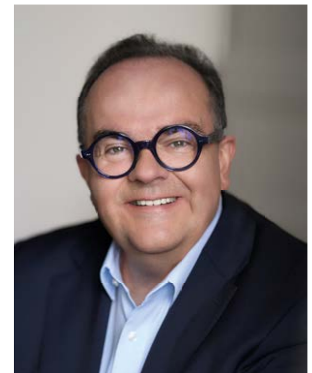
Clemens Baumgärtner