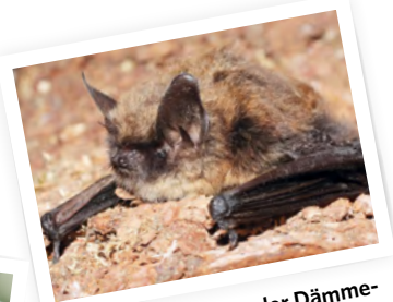
Fledermäuse jagen in der Dämmerung und profitieren von Pflanzen, die nachts blühen und nachtaktive Insekten anlocken.