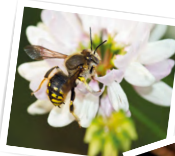
Die Männchen der Wollbiene verteidigen zuweilen ihre Blüten vor anderen Männchen.