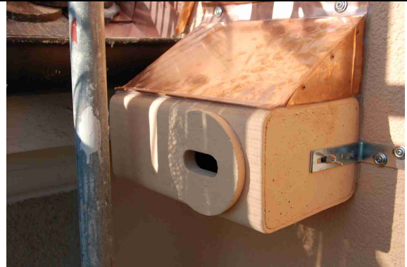
4 Ersatznistkasten mit Taubenabwehrblech für den durch die Dämmung unzugänglichen Nistplatz