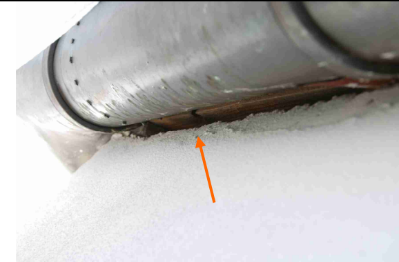
6 Nord- und Ostseite: Traufe verputzt, Einschlußöffnungen (Pfeil) erhalten