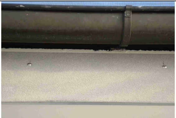
7 Süd- und Westseite: Abhangblech rau besandet, um Seglern Halt zu bieten