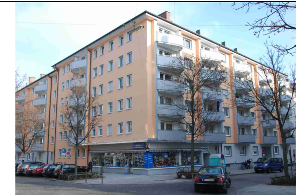
8 Das fertig sanierte Gebäude