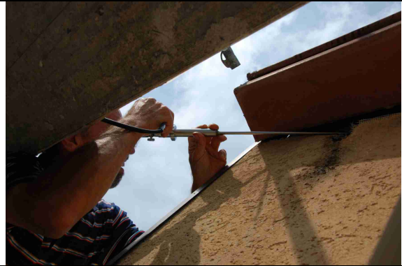
2 Überprüfung der Anwesenheit von Fledermäusen mit dem Endoskop