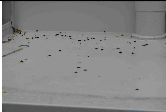
5 Kots Spuren unter Abendsegler-Ersatzquartier - Annahme noch im Herbst