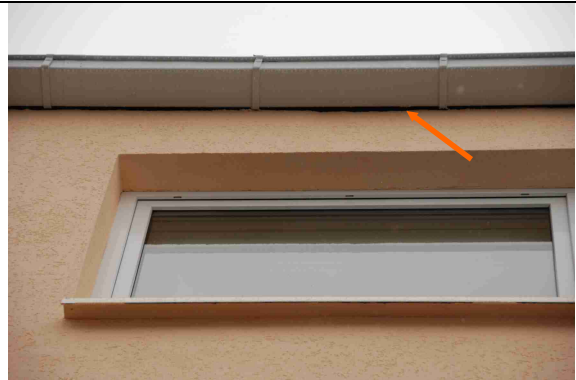
6 Einflugschlitz zum Zwergfledermausquartier, erhalten nach Sanierung