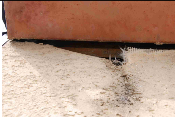
1 Abendseglerquartier hinter Schadstelle der alten Wärmedämmung