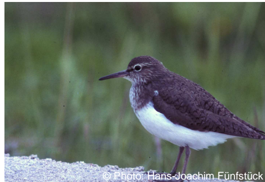
Flussuferläufer

Vom Flussuferläufer werden bayernweit nur noch 150-180 Brutpaare gezählt. Damit ist er bei uns vom Aussterben bedroht! Er brütet ebenfalls am Boden, in der Pioniervegetation kiesiger Flussaufsüttungen von größeren, wildflussartigen Fließgewässern. Dies findet er in Bayern nur in den Alpen und entlang der dealpinen Flüsse. Der Oberlauf der Isar ist noch eines seiner Schwerpunktorkommen.