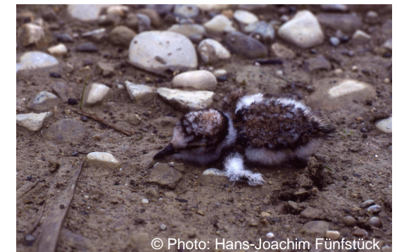
Junger Flussregenpfeifer, der beinahe verendet wäre, da die Mutter vor in der Nähe lagernden Menschen flüchtete.

Landratsamt München Untere Naturschutzbehörde